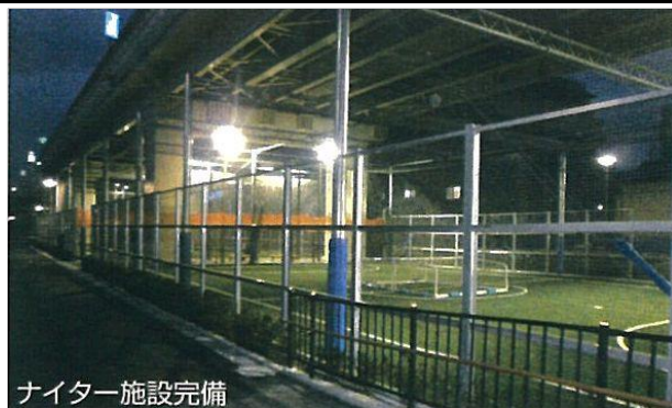
ナイター施設完備